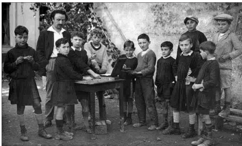
С. Френе с детьми

В 1965 г. в журнале «L'Éducateur» С. Френе, подводя итог своей 45-летней деятельности, констатирует факт официального признания многих его идей: его имя занимает достойное место рядом с такими именитыми педагогами-реформаторами конца XIX — начала XX вв., как О. Декроли, М. Монтессори, А. Феррьер, Э. Клапаред, Е. Паркхерст и др.; более того, методы педагогики Френе охот-