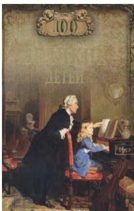
Помелов В. Б. 100 великих де- тей. М., «Вече», 2021, 384 с.

каждой представленном им педагоге нечто особенное, интересное, неповторимое, и, опираясь на эту «особинку» выстраивал свой рассказ. Вот почему все очерки очень разнообразны. Это не сухая констатация каких-то фактов и данных, а интересный рассказ, своего рода «педагогика в лицах» .