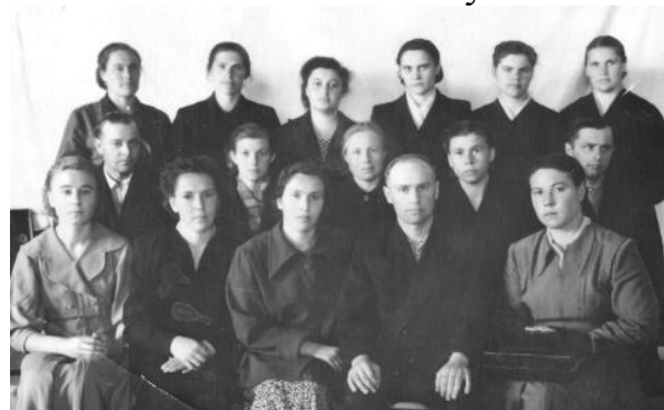
Педагогический коллектив Троицкой средней школы, 1959 г.

людей, которые проработали определенное время под его руководством. Видно, что они вспоминают своего директора только с глубоким уважением, добротой и теплотой, человека, который оставил значительный след в их жизни, стал для них учителем и наставником с большой буквы.