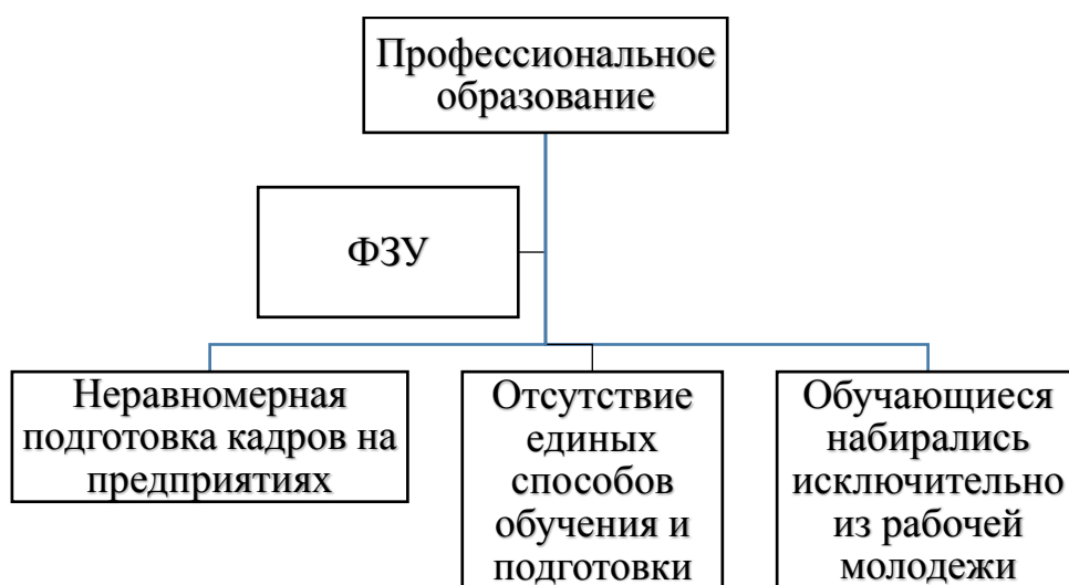
Рис. 2. Основные проблемы в ФЗУ

При этом, у обучающихся формировалась коллективная и личная ответственность за выполняемые производственные задачи. Многие из учеников требовали не только воспитательного, но и личного контроля за дисциплиной. Учебная часть определялась педагогическими условиями обучения и постановкой конкретных дидактических задач.