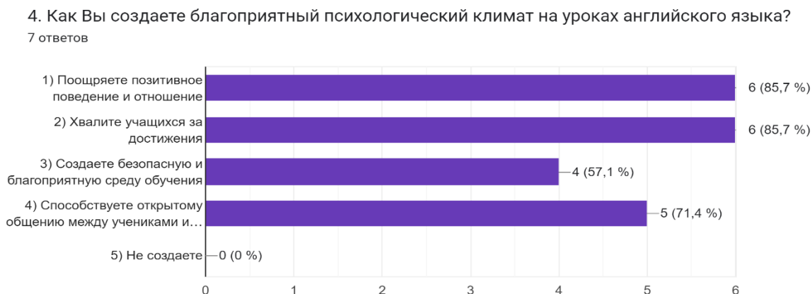
Рис. 1. Результаты опроса педагогов о приемах создания благоприятного психологического климата на уроке

благоприятный психологический климат на уроках английского языка?» педагоги ответили следующим образом (рис. 1).