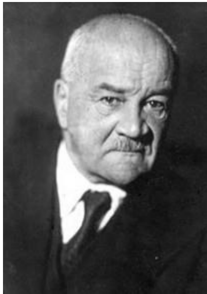
Ю. В. Готье

Его учеником и продолжателем выступил представитель второго поколения научной школы видный отечественный историк-медиевист, академик АН СССР Юрий Владимирович Готье (1873–1943)