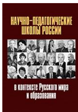
Коллективная монография «Научно-педагогические школы России»

Наиболее полно о деятельности научной школы сообщается в книге «Научно-педагогические школы России в контексте Русского мира и образования. Коллективная монография / Под ред. Е. П. Белозерцева. 2-е издание. – Москва : АИРО-XXI, 2017. 592 с.