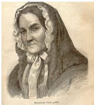
Тереза фон Брунsvик де Коромпа