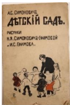
Обложка журнала «Детский сад»

нителя и интерпретатора идей Фрëбеля взяли на себя периодические издания: журналы «Современник», «Детский сад», газеты «Русский инвалид», «Голос» и др.