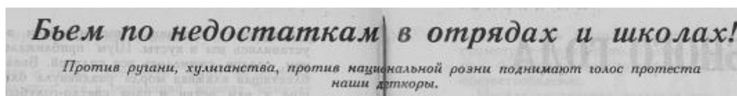
Рис. 5. Лозунг стенной газеты читателей «Пионера» № 10 «Бумеранг»

могла быть использована для оформления отрядных уголков. В то же время в ней четко прослеживались основные рекомендуемые рубрики: темы для обсуждения в отряде по различным проблемам (о дружбе ребят между собой, воспитанию в пионерах качеств нового человека, отношению к хулиганским поступкам, о национальной розни и т. д.), карикатуры и художественные иллюстрации, краткая информация об основных достижениях отряда, кружка, описания полезных дел, которые сделали пионерские отряды, а также рассказы/стихотворения, написанные деткорами (рис. 5).