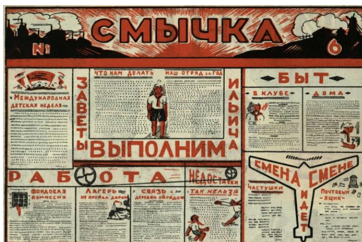
Рис. 3. Пример оформления стенгазеты

размеру стенгазеты (высота 1 м и ширина 1,5 м.), размеру заголовка (не меньше ¼ высоты газеты), длине строк, расстояния между столбцами и т. д., что может быть полезным и современным школьникам при оформлении своих стенгазет (рис. 3).