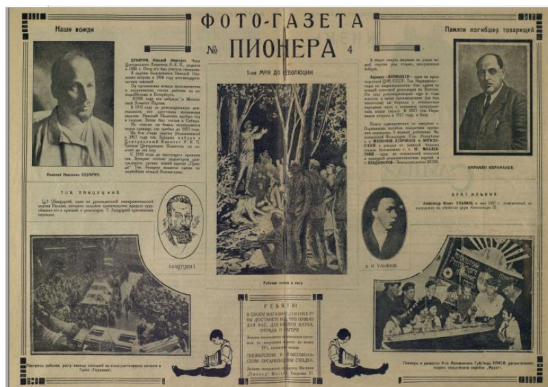
Рис. 2. Фото-газета Пионера

Интерес представляет заметка, расположенная внизу этой фото-газеты – в ней представлена реклама магазина «Пионер», в котором наложенным платежом можно заказать те или иные товары «...для вас, для вашего клуба, отряда и лагеря» [Фото-газета Пионера, 1925, с. 12–13].