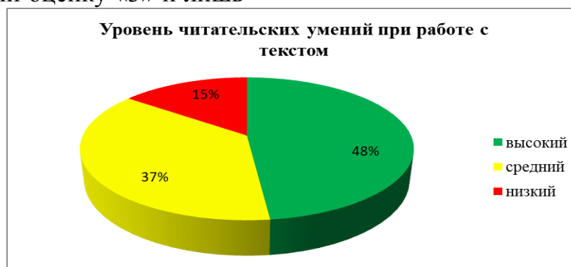
Рис. 2. Результаты исследования умения обучающихся четвертого класса работать с текстом

На втором этапе работы были предложены задания к тексту. Результаты представлены на рис. 2.