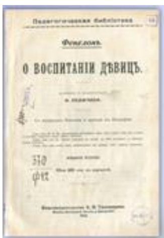
Книга Ф. Фенелона «О воспитании девиц»

гуманное обращение с детьми [Джуринский..., 1999, с. 502]. Содержание книги проникнуто духом гуманизма, который в эпоху Ф. Фенелона еще не стал непременной частью европейского образования [Помелов..., 2019].