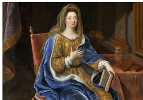
Маркиза де Ментенон

Школа Сен-Сир была открыта в 1684 г. королем по настоянию воспитательницы детей Людовика XIV Франсуазы д'Обинье (1635–1719), больше известной под именем маркиза де Ментенон, или мадам де Монтеспан 6 .