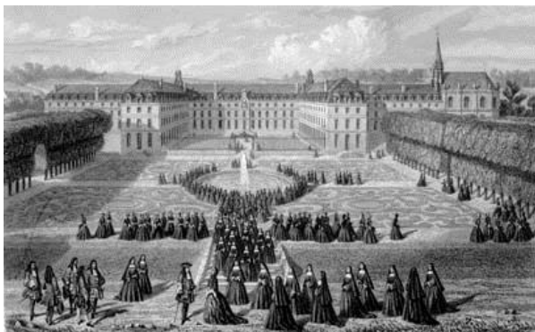
Сен-Сир. Гравюра конца 18 века

не в состоянии дать дочерям достойного образования. Строительные работы под руководством королевского архитектора Ардуэна Мансара заняли всего 15 месяцев.