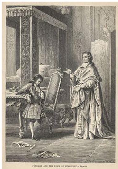
Ф. Фенелон и юный герцог Бургундский (художник А. де Невиль)

Бургундского, ставшего со временем королем Испании Филиппом V.