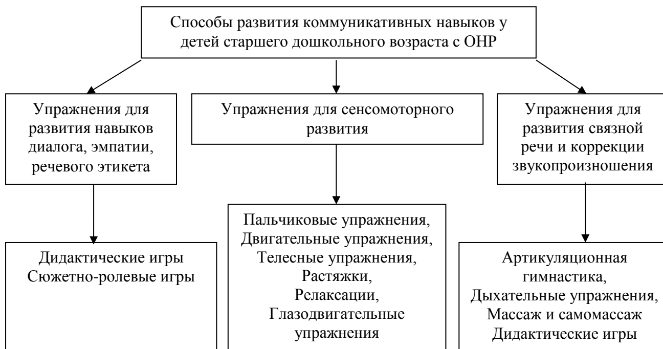
Рис. 4. Схема способов развития коммуникативных навыков у детей старшего дошкольного возраста с общим недоразвитием речи

Способы развития коммуникативных навыков у детей старшего дошкольного возраста с общим недоразвитием речи мы представили в виде схемы.