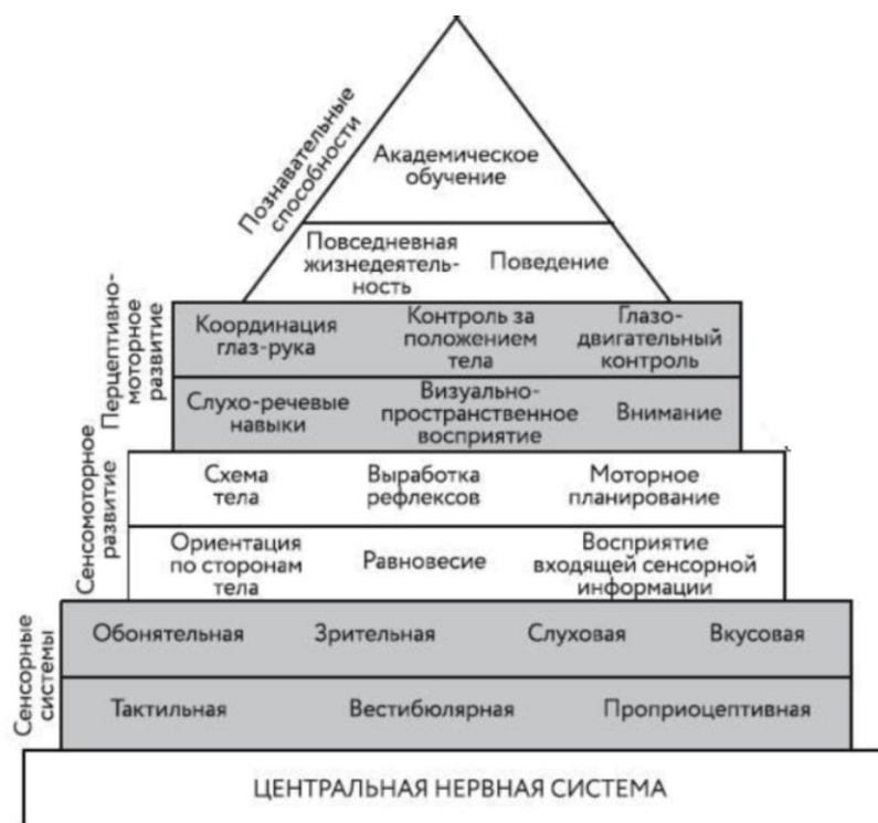
Рис. 1. Пирамида обучения Вильямс и Шелленбергер

видно, какой огромный путь должен пройти в своём развитии ребёнок, чтобы у него сформировалась полноценная речь [Тимощенко, 2023].