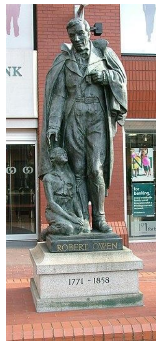
Рис. 5. Памятник Р. Оуэну в Манчестере

Заключение. Наследие великого социалиста и педагога Роберта Оуэна столь значимо, что его просто невозможно охватить в одной статье. Сформулируем лишь некоторые важные выводы.