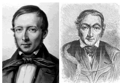
Рис. 1. Р. Оуэн в молодости и в зрелые годы

Юный Роберт был шестым из семи детей в семье. В детстве он отличался необычайными способностями к обучению. В 5 лет он пошел в местную школу, а уже спустя два года учитель использовал способного мальчика как своего помощника для обучения других детей, многие из которых были старше Роберта. Он перечитал все книги в домашних библиотеках местного доктора, учителя и предпринимателя. В девять лет школьное образование Оуэна навсегда закончилось, и он отправился искать счастья в больших городах. В течение четырех лет он служил учеником и приказчиком в мануфактурных магазинах Стэмфорда и Лондона.