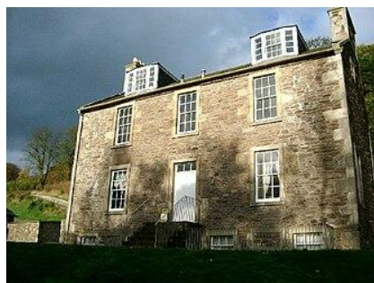
Рис. 3. Дом Р. Оуэна в Нью-Ланарке

ловича Романова, будущего императора Николая I. Он даже предложил Оуэну взять с собой два миллиона «излишнего» британского населения и переселиться в Россию. При этом он обещал всевозможную помощь и преференции, но Оуэн отказался от этого предложения.