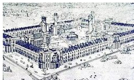
Рис. 4. Вид коммуны Новая Гармония

Постепенно в «высшем обществе» Р. Оуэна стали считать опасным мечтателем. Разочаровавшись в английском «образованном обществе» и утратив своё влияние даже в Нью-Ланарке, Оуэн с детьми уехал в США в октябре 1824 г. В 1825 г. он купил в штате Индиана на реке Уобаш целый посёлок под названием Гармония (Harmony), включавший в себя 180 домов и территорию 30 тысяч акров (1 акр равен 0,405 гектара) земли за 200000 талеров, и организовал на этой территории коммунистическую производительную общину «Новая гармония» (New Harmony), устав которой основывался на принципе уравнительного коммунизма.